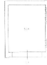
Piano terra h. 2,30