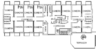
PIANO PRIMO H+2,85 M