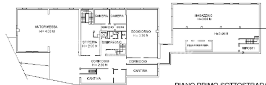
PIANO PRIMO SOTTOSTRADA