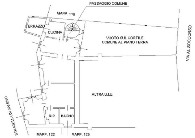
PIANO PRIMO H. 2.70m