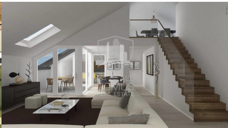
Como, Lussuoso attico di nuova costruzione , Superficie: 192 m 2